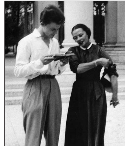
Gérard Philippe et sa mère, à Rome