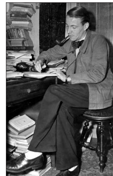
Georges Perros vers 1947